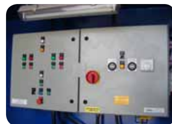
Tableau de contrôle