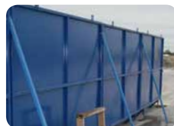
Étanchons pour les sites exposés